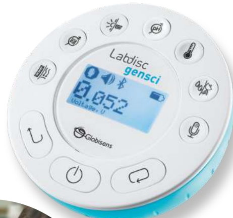
Czujniki umieszczone na obudowie dysku