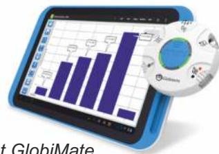
Tablet GlobiMate z dyskiem Mini