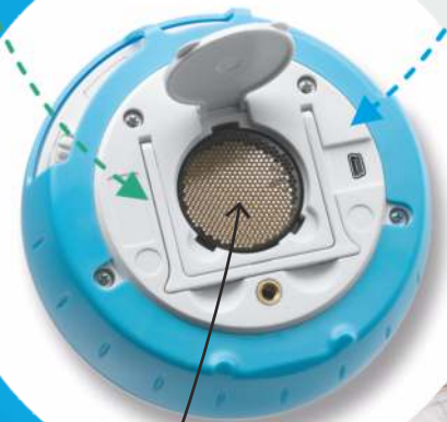
Czujnik odległości umieszczony z tyłu dysku